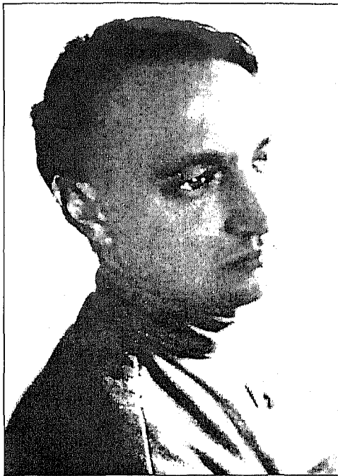
Н. Н. Пунин

пенный выход русской школы живописи из сферы влияния французского кубизма и мастерски написанного, хранится в Отделе редкой книги Национальной библиотеки Республики Карелия (НБРК). На титульном листе книги авторская дарственная надпись: «Честолюбцу, что б и не думал о славе, с дружеским приветом и впредь спасу от славы. Пунин. 1921. 7. XII». Помимо того, что эта надпись Н. Н. Пунина, тонкого художественного критика, одного из организаторов системы художественного образования и музейного дела в советской России, мужа А. А. Ахматовой, делает экземпляр НБРК библиографической редкостью, само посвящение не может не заинтриговать читателя. Кто был этим «честолюбцем» и каким образом Пунин мог «спасти» его от славы?