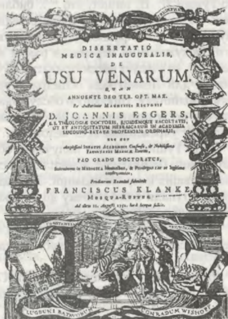
Кланке Ф. О назначении вен (Лейден, 1725 г.). Титульный лист одной из первых диссертаций, защищенных российским врачом.

при этом не столько к практике, сколько к авторитетам, особенно античным. В гармонии с содержанием находилось и оформление работы: титульный лист украшали гравюры с изображением врачей древности, покровительницы науки Минервы, бога врачевания Асклепия, его животворящего жезла кадуция, обвитого аспидом; иногда в сюжете присутствовал и сам герой в лавровом венке со свитком докторского диплома в руках.